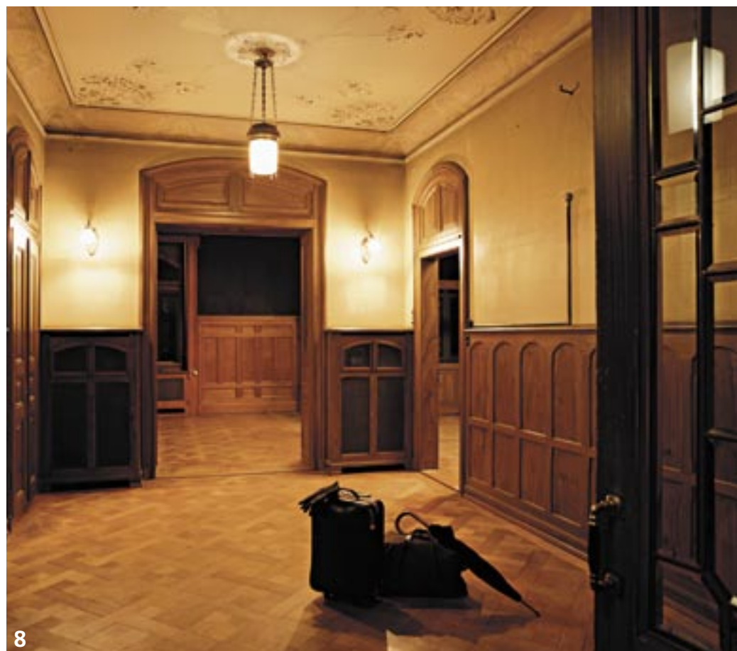
→ 8 Living the Villa: Im Vestibül wird die Grandezza des Hauses sichtbar. Sie steht nun zum Verkauf. www.verbina.ch