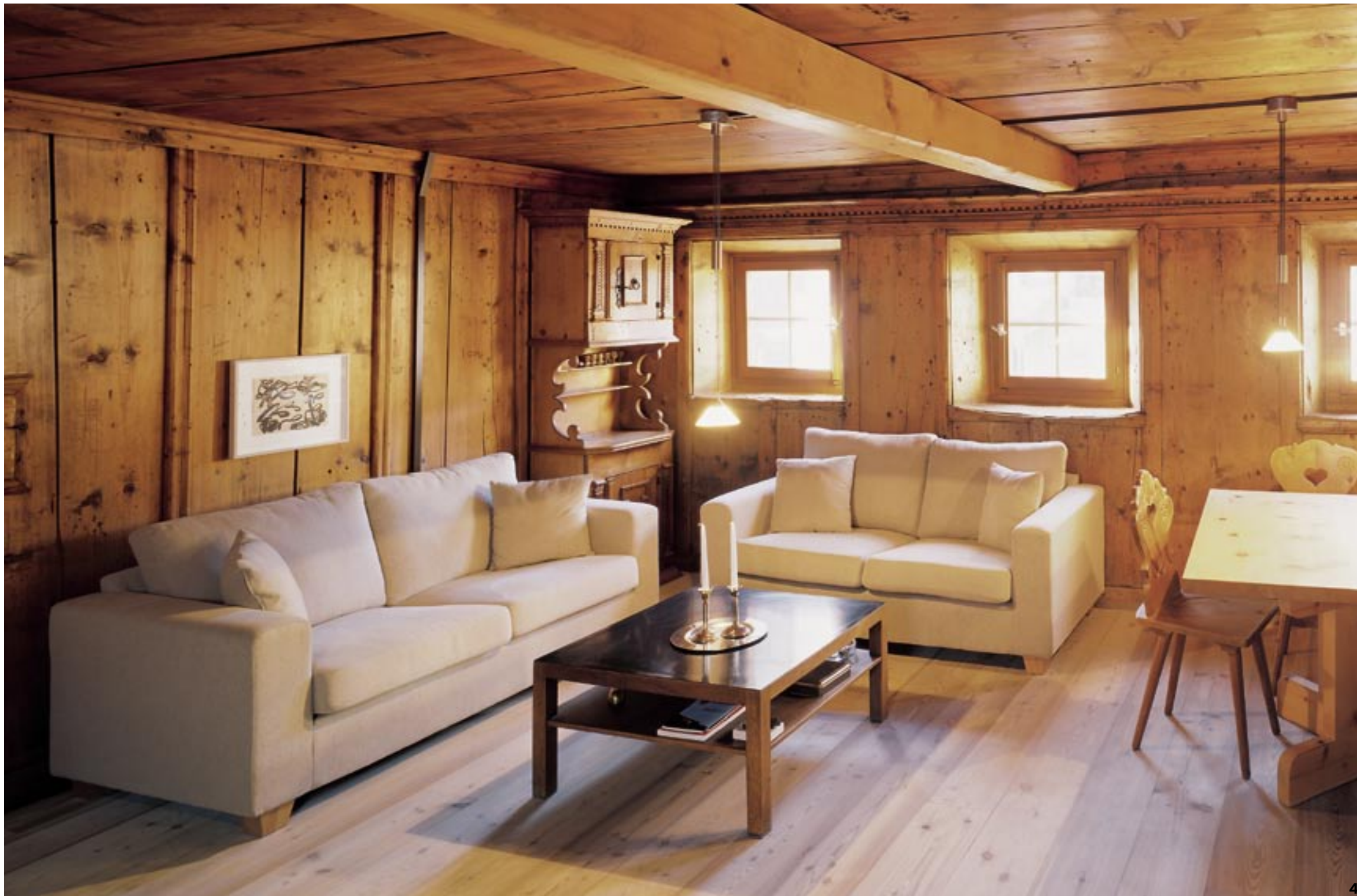
4: Die alte gotische Stube wurde telquel belassen. Der Teppichboden aus den 70er-Jahren wurde durch einen Dielenboden ersetzt. 5: In den Schlafzimmern findet man historische Malereien aus verschiedenen Jahrhunderten. Zum Teil haben sich hier reisende Maler verewigt. 6: Das Kreuzgewölbe im Gang verbindet die gemauerten Tonnengewölbe mit dem zur Strasse hin vorgelagerten, hölzernen Strickbau.