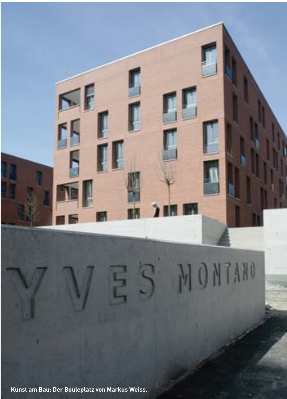
Kunst am Bau: Der Bouleplatz von Markus Weiss.

dungsfindungen zu anderen Urteilen. Wir müssen aufhören, von den Architekten und den Investoren zu reden, weil hinter diesen Begriffen Personen stehen, die sehr unterschiedliche Wertvorstellungen und Interessen haben.