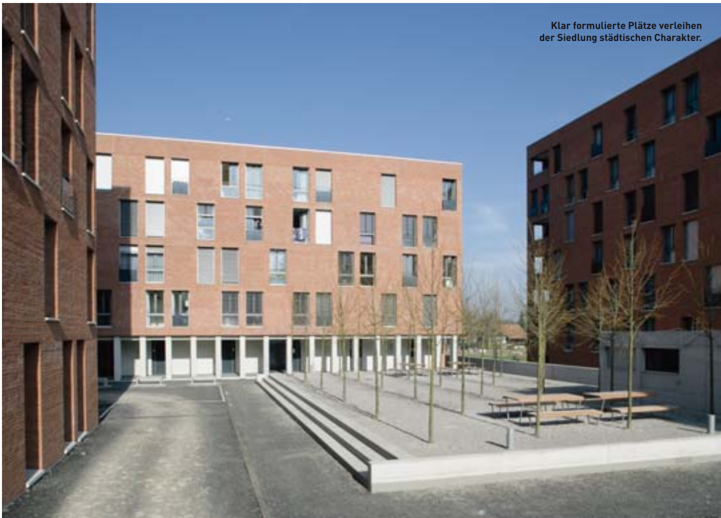
Klar formulierte Plätze verleihen der Siedlung städtischen Charakter.