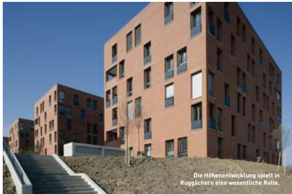
Die Höhenentwicklung spielt in Ruggächern eine wesentliche Rolle.

Die Aussenansicht ist Teil davon. Es geht aber auch um die Volumetrie und um die zu tiefst städtebaulichen Beiträge. Was generiert ein Gebäude an öffentlichem Mehrwert? – Das ist die zentrale Frage. Das Gebäude sollte nicht primär von innen nach aussen entworfen werden, sondern von aussen nach innen. Der Beitrag zur Stadt oder zum Ort ist viel wichtiger als der Beitrag zur Nutzung. Die Geschichte selektiert automatisch.