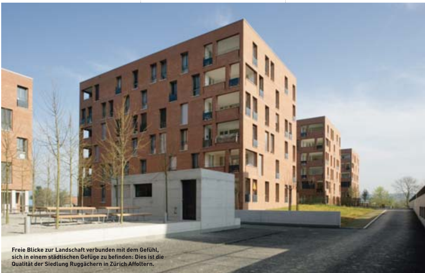
Freie Blicke zur Landschaft verbunden mit dem Gefühl, sich in einem städtischen Gefüge zu befinden: Dies ist die Qualität der Siedlung Ruggächern in Zürich Affoltern.

Nein, ich bin der Meinung, dass Schönheit langfristig Bestand hat. Es ist zum Beispiel nicht so, dass Museumsbesucher nur moderne Bilder als schön empfinden, es ist tendenziell in der Gesellschaft so, dass wir ein hohes Bewusstsein dafür haben, dass es Dinge gibt, die eine sehr hohe Lebenserwartung haben und diese Wertbeständigkeit verknüpfen wir auch mit dem Begriff der Schönheit. Das trifft auch auf Gebäude zu. Es ist überhaupt nicht so, dass wir die Schönheit mit der Kurzfristigkeit