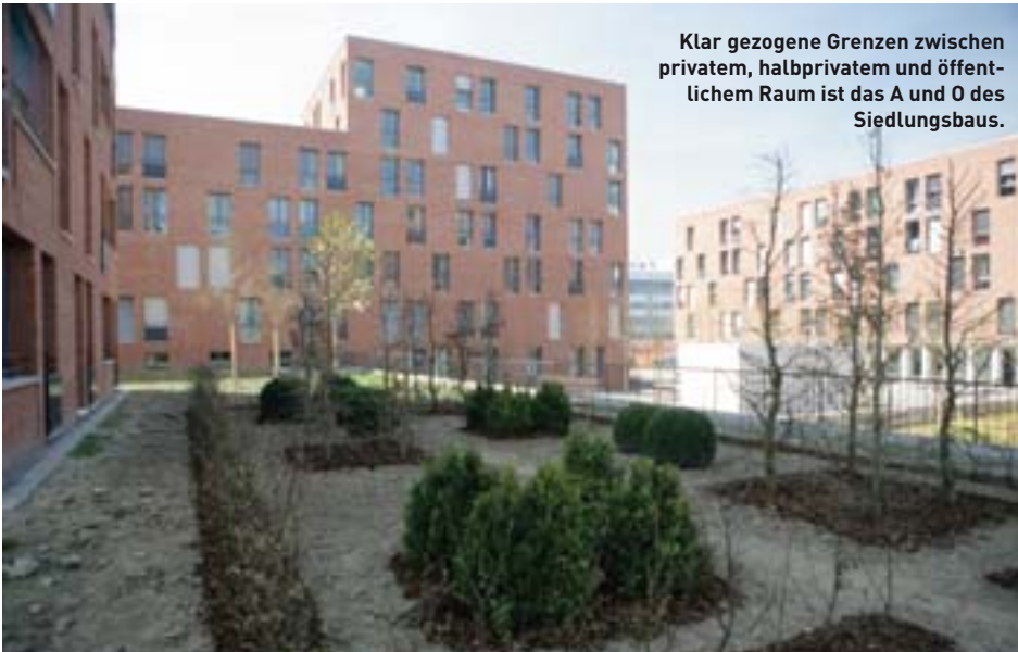
Klar gezogene Grenzen zwischen privatem, halbprivatem und öffentlichem Raum ist das A und O des Siedlungsbaus.