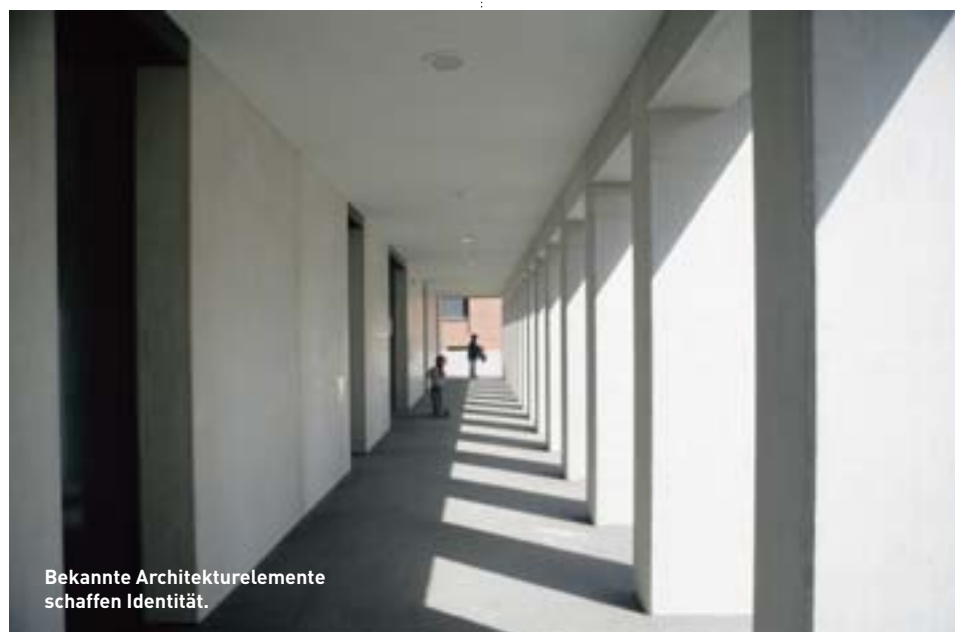
Bekannte Architekturelemente schaffen Identität.

Planung: Baumschlager Eberle Ziviltechniker GmbH, Lochau